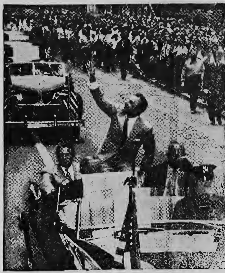
DE AMERIKAANSE golfkampioen Ben Hogan werd op grootse wijze in New York ontvangen, toen hij uit Engeland terugkeerde, met ook de Britse kampioentitel in zijn zak. Het werd een "heldenwelkom", zoals slechts weinig krijgen.

ROME. Een woordvoerder heeft vandaag meegedeeld, dat de Italiaanse demissionaire premier, Alcide de Gasperi, zal weigeren